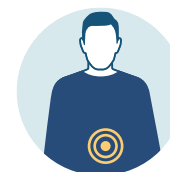
NÁUSEAS O VÓMITOS