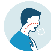
FALTA DE ALIENTO O DIFICULTAD PARA RESPIRAR